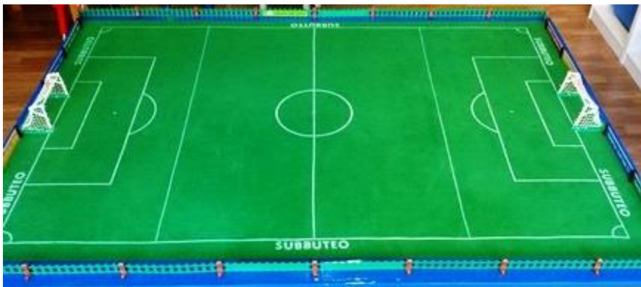
Fig. 1 (Panno verde di giuoco formato da: Campo di giuoco + la zona del panno oltre le linee perimetrali)

Campo di giuoco: L'intera struttura formata da Terreno di giuoco + Campo per destinazione + Recinzione + Area fuori dalla recinzione.